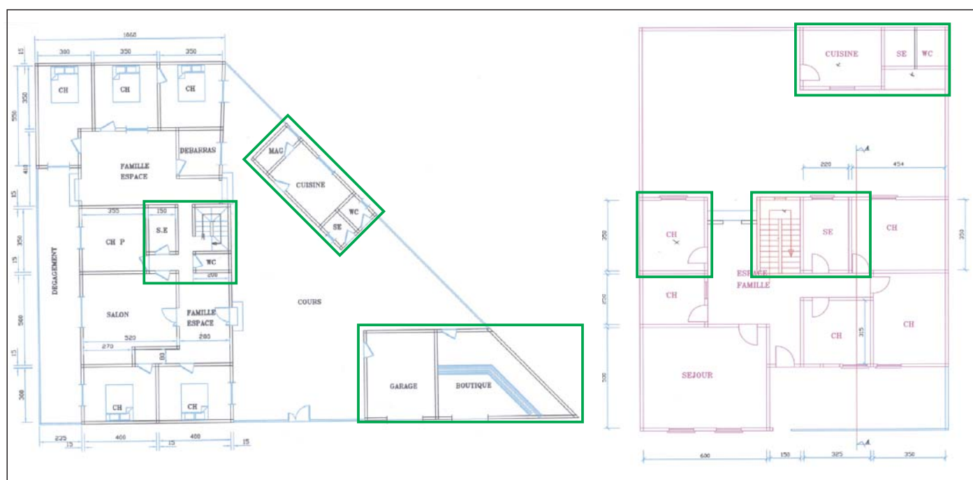
Bargny, quartiere Castors - Nell'esempio a sinistra il vano scale non fa parte del progetto originale, ma costituisce un'integrazione introdotta dai proprietari, come la cucina all'esterno, il garage e il negozio. Nell'esempio di destra sono evidenziate le modifiche al progetto originale. Si noti anche qui la delocalizzazione verso l'esterno della cucina.

Del soggiorno si è già detto. Mantenuto spesso chiuso a chiave e sempre perfettamente in ordine, è in genere arredato secondo un gusto lezioso e sovrabbondante,