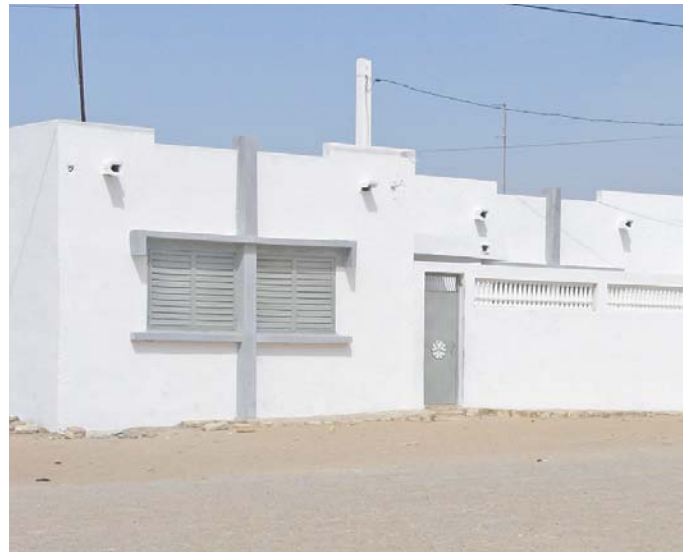
Bargny, quartiere Castors - Unità abitative come da progetto originale.

Come nel caso dei Villaggi Marcolini, l'esperienza di Castors si è dimostrata molto positiva, contrariamente alle attese di molti cittadini di Bargny: pareva si trattasse di un quartiere operaio destinato ad essere progressivamente abbandonato dai soci al termine della loro vita lavorativa, per fare ritorno alla maison familiale . Non è questo ciò che è capitato, nonostante il quartiere